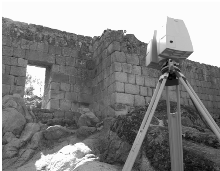
Fig. 3 – Levantamiento con Láser Escáner de la muralla entre la T1 y la T2.