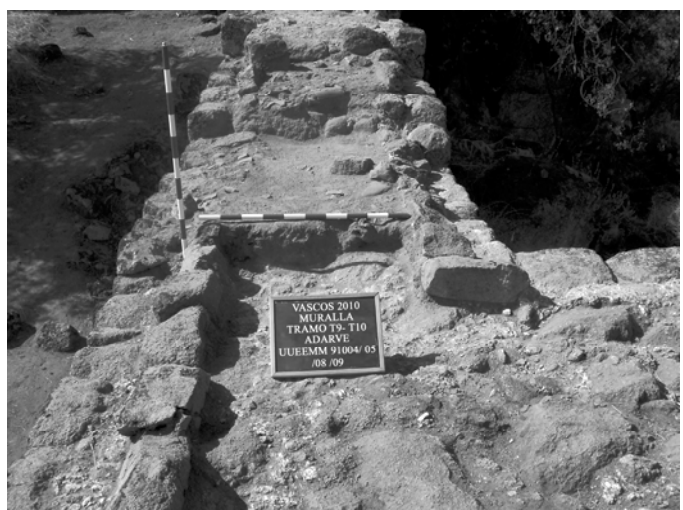
Fig. 4 – Proceso de excavación del adarve de la muralla detalle entre la T9 y la T10.