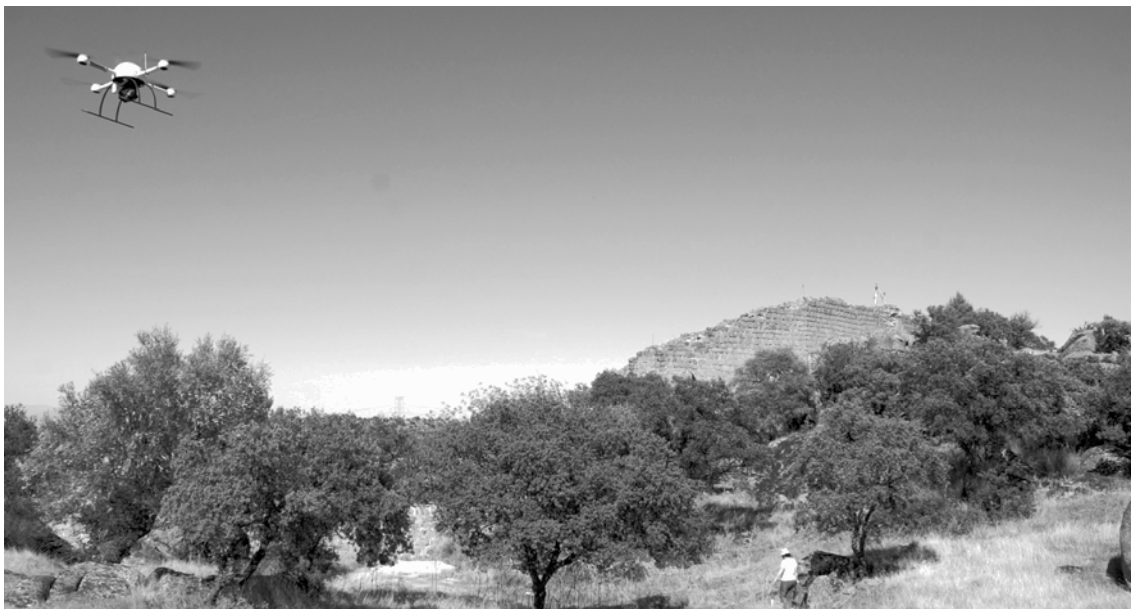
Fig. 2 – Levantamiento de la planimetría a través de fotografía tomada con microdrone.